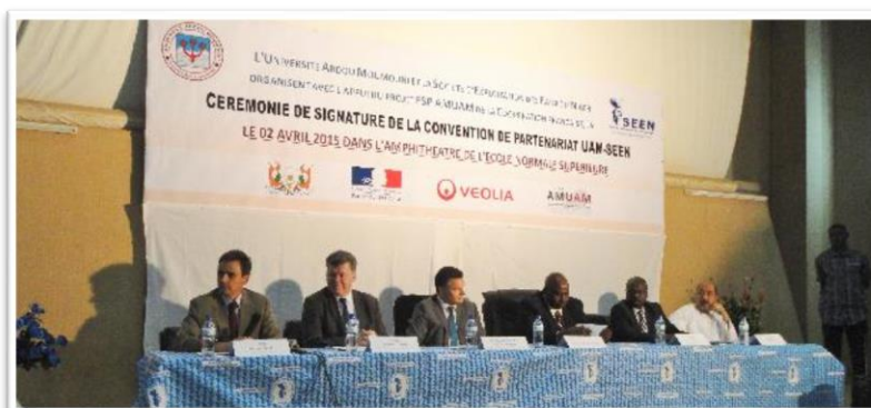
Cérémonie de signature convention SEEN-UAM, 05/2015