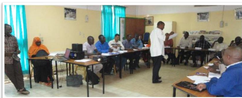
Séance de formation du CDFU-UAM, 11/2015